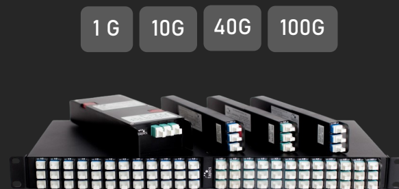
Châssis 1U embarquant des TAP OWL 850/1310/1550 nm